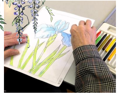
【壁紙作り】 季節の絵を使って 色塗りをしています