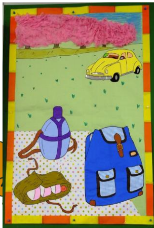
春らしく可愛い壁紙が できました♪