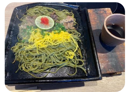
山口名物瓦そばを食べて帰りました