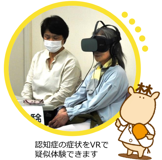
認知症の症状をVRで疑似体験できます