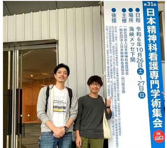
当院からは病棟主任2名が参加しました